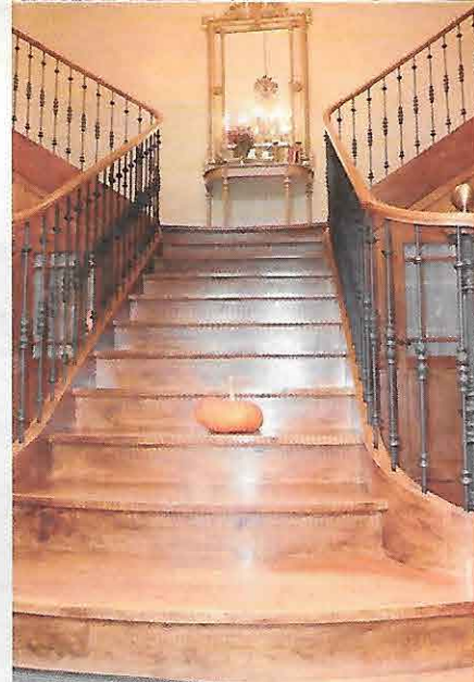
À l'automne, trônent souvent aux quatre coins de la maison, ici sur l'escalier menant aux chambres, des potimarrons du jardin

► Depuis 2003, ils suivaient leurs parents qui venaient passer l'hiver à Condom pour diriger les travaux de rénovation de leur petit château. Les enfants ont donc été scolarisés une partie de l'année à Condom, l'autre à Hampton Beach, jusqu'en 2012, quand la famille s'installe à Condom pour ouvrir Les Bruhasses.