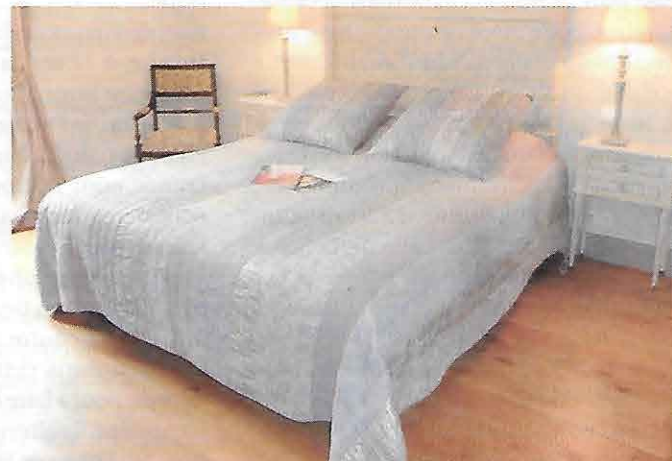
L'une des chambres de la maison, tout en couleurs pastel